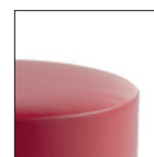
Versione monocolore One colour version