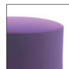
Versione bicolore Two colours version